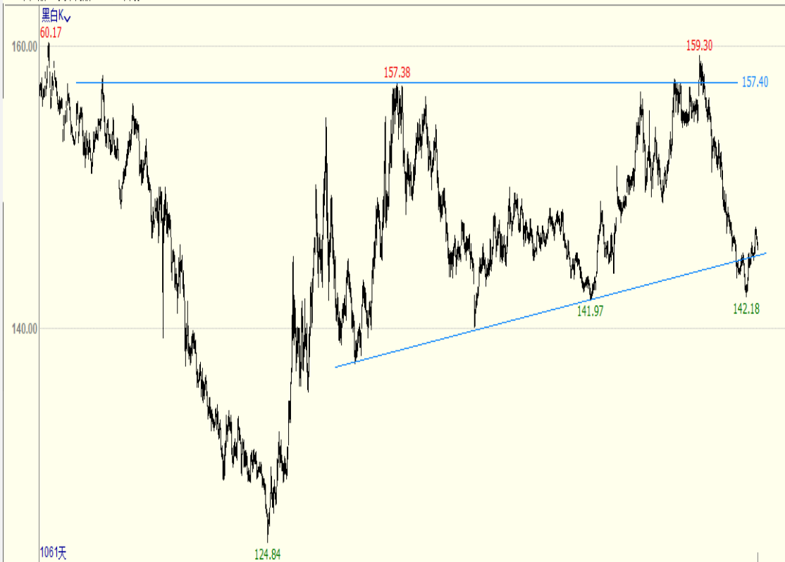
农产品 (文华商品 7192) 1小时