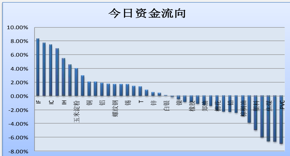
图一：当日资金流向概览

地址：北京市东城区东直门南大街 3 号国华投资大厦 8 层 国都期货有限公司 网址：www.guodu.cc